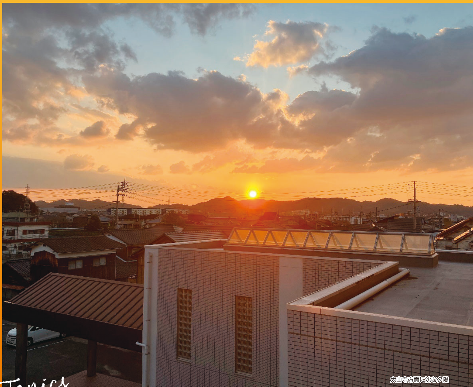
太山寺方面に沈む夕陽